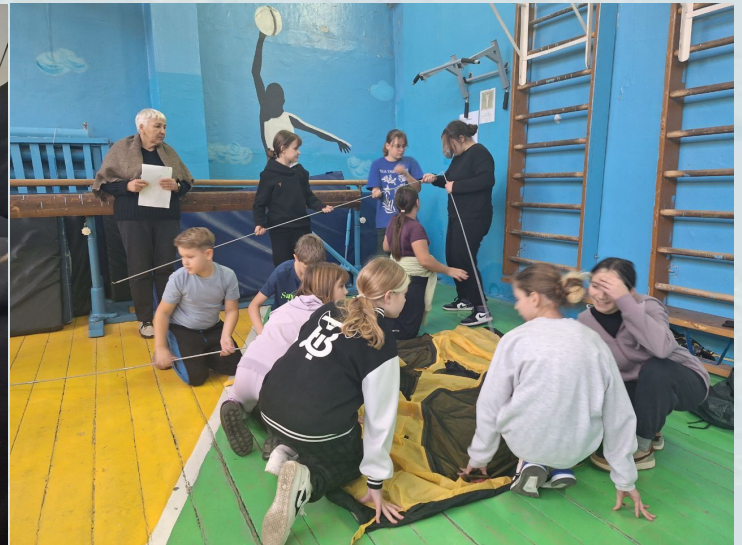
Фото с туристической игры